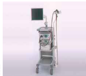
フジノン社製内視鏡