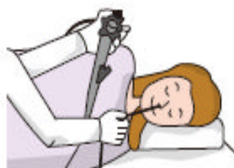
経鼻アプローチによる 内視鏡検査